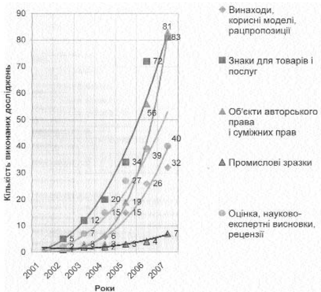
Рис. 2 Динаміка виконання спеціальних досліджень ОІВ спеціалістами НДІ ІВ АПРН України за зростаючим підсумком з 2001р. по 25.05.2007 р.

тролю, а упевненість у правильності висновків про належність, допустимість, достовірність і достатність доказів, яка базується на всебічному, повному та об'єктивному розгляді фактів [11].